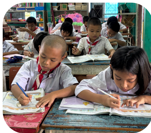
Uniforme scout pour les plus jeunes

Après cela, nous dînons (repas préparé en amont par quelques enfants), avant d'avoir un peu de temps libre.