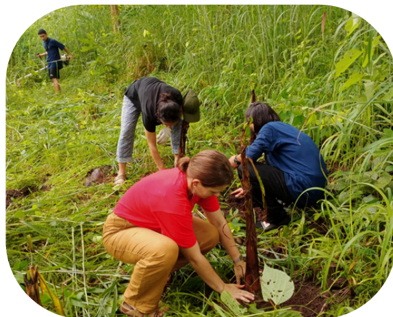
Défrichage et plantation de bananiers !

L'avantage c'est qu'en plus de connaître le Je Vous Salue Marie en français et en anglais, je le connais maintenant presque en thaï !