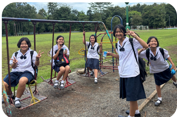
Uniforme de l'école pour les filles