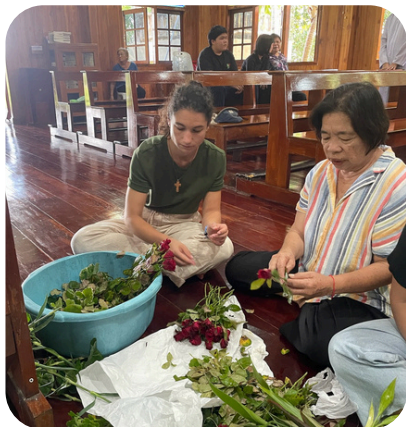
Préparation des bouquets pour fleurir l'église