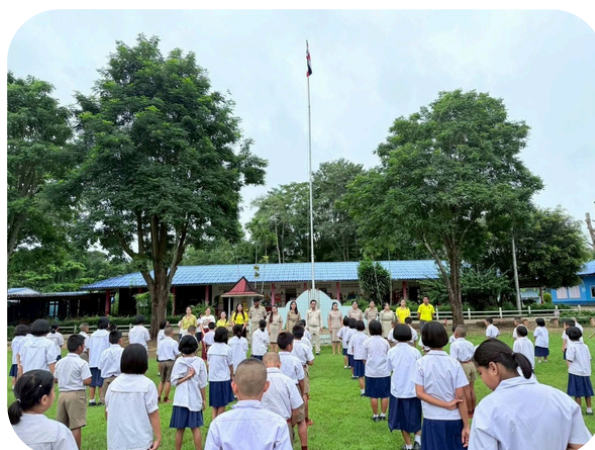
Lever des couleurs à l'école